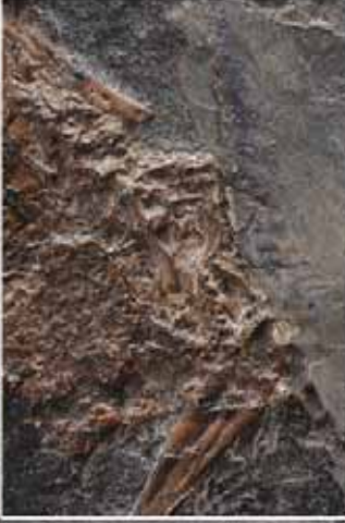
50 milyon yıllık kuş fosili