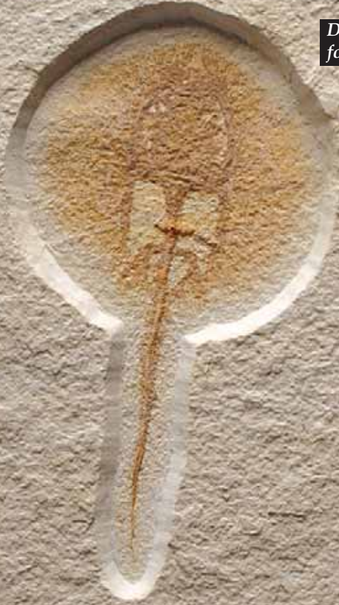
Dikenli vatoz fosili