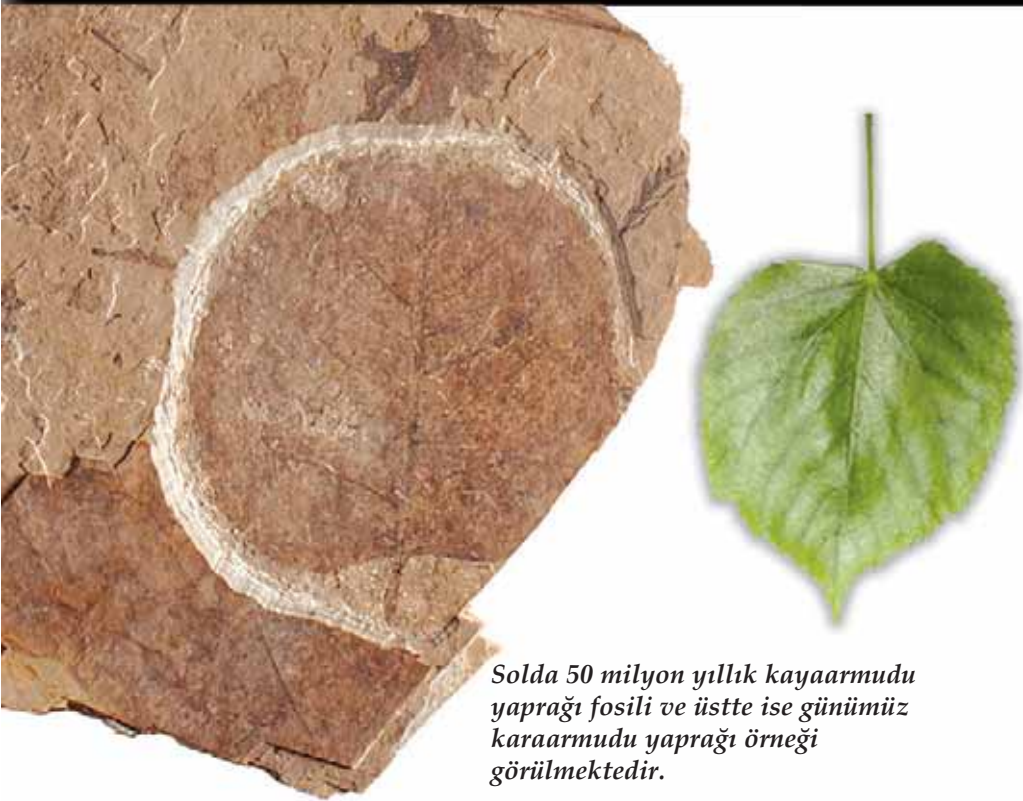
Solda 50 milyon yıllık kayaarmudu yaprağı fosili ve üstte ise günümüz karaarmudu yaprağı örneği görülmektedir.

"Mutasyonların havyanların ve bitkilerin ihtiyaçlarının karşılanmasını sağladığına inanmak, gerçekten çok zordur. Ama Darwinizm bundan fazlasını da ister: Tek bir bitki, tek bir havyan, tam olması gerektiği şekilde binlerce ve binlerce faydalı tesadüfe maruz kalmalıdır. Yani mucizeler sıradan bir kural haline gelmeli, inanılmaz derecede düşük olasılıklara sahip olaylar kolaylıkla gerçekleşmelidir. Hayal kurmayı yasaklayan bir kanun yoktur, ama bilim bu işin içine dahil edilmemelidir." (Pierre-Paul Grassé, Evolution of Living Organisms , s. 103)